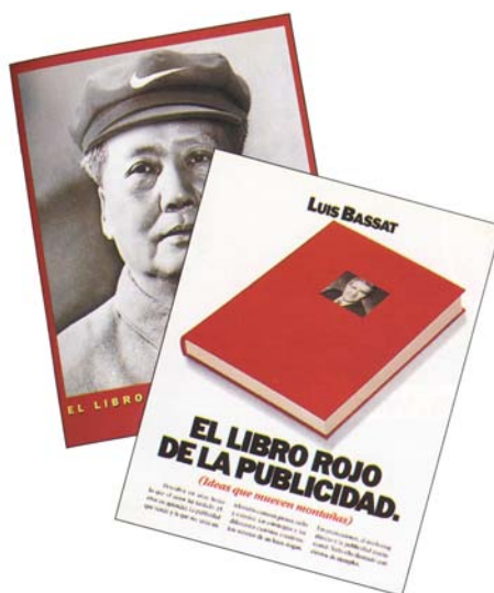
Fig. 6. El libro rojo de la publicidad y El libro rojo de las marcas.