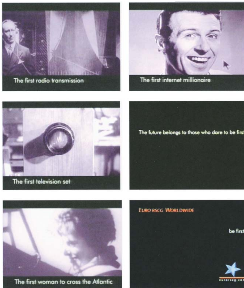
Fig. 9. Spot Euro RSCG.