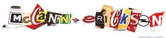
Fig. 1. Inserción autopublicitaria fcb/tapsa.