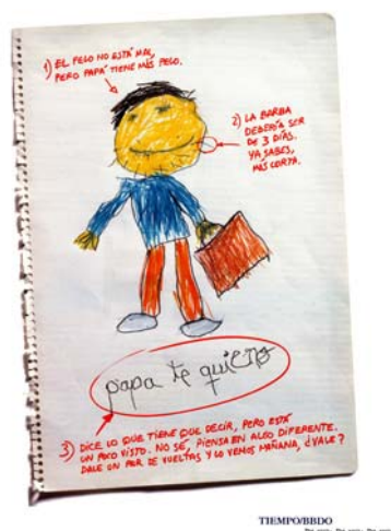
Fig. 4. Inserciones autopublicitarias: aplicación de cromatismos corporativos.