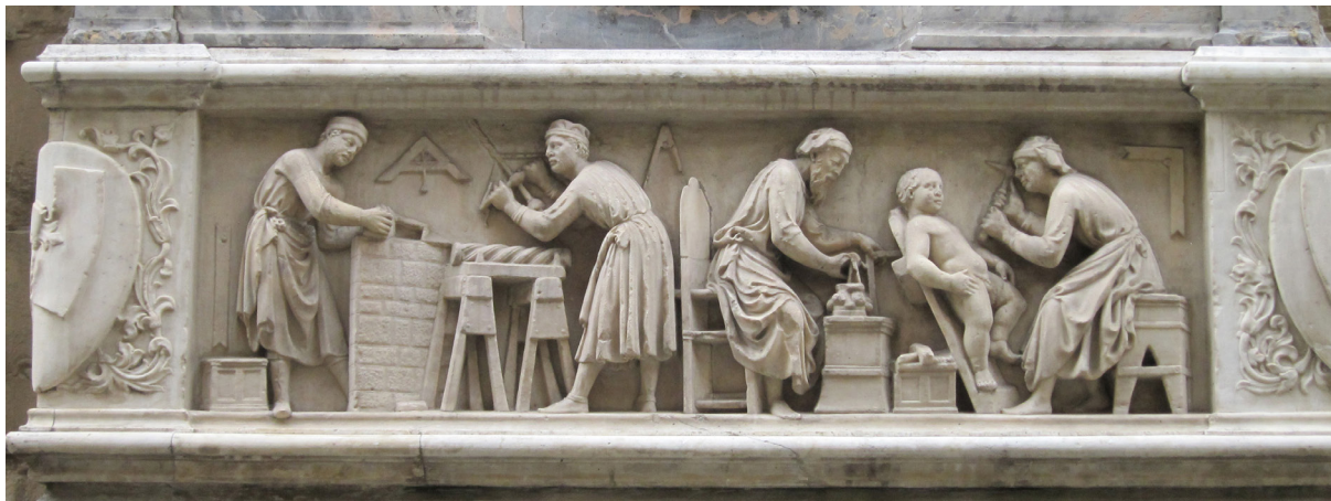
Figura 3. Taller de Escultores de Nanni di Banco (1336) para la base del nicho en el gremio de Orsanmichele.

Al hilo de lo dicho, la figura del pregonero gozaba de una institucionalización y reglamentación más amplia. Sólo en la ciudad de París, de apenas cien mil habitantes en el s. XIII, aparecieron 400 pregoneros registrados que trabajaban bajo unas estrictas tarifas voceando los productos. La exposición de los productos estaba marcada por las franjas horarias (Tapia Frade, 2014). Mientras que de día se mostraban los artículos de primera necesidad, como los alimentos, el pan y el vino, de noche se vendían otros artículos como telas, prendas y objetos de carácter personal e identidad desconocida, tal y como afirman autores como Russell, Lane y Whitehill (2005, p. 9).