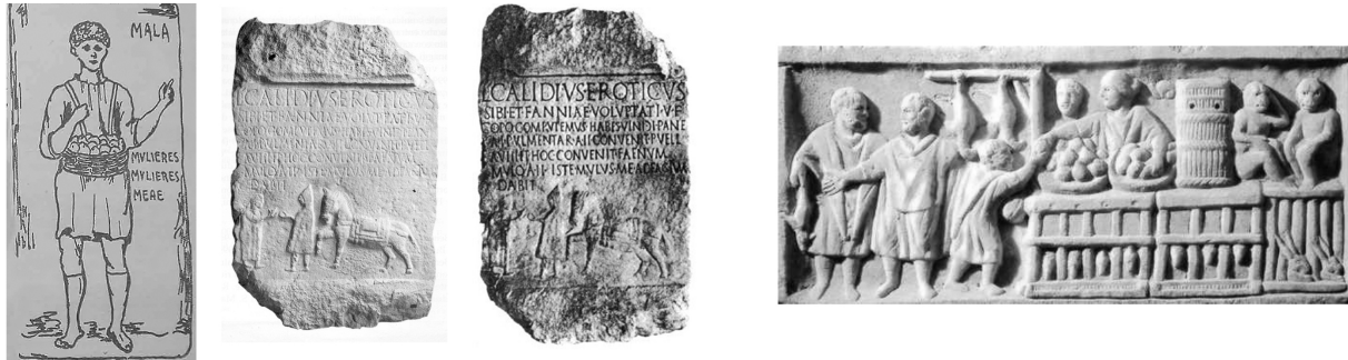
Figura 2. Bajorrelieve de un vendedor de frutas, donde aparece el eslogan “ mala, mvlieres, mvlieres meae ” (Lillo Redonet, 2009, p. 28). Lápida funeraria de Lucius Calidius Eroticus (Sánchez, 2014) y Escenas de mercado como la reproducida en este bajorrelieve se repetirían en los núcleos urbanos. (Urteaga Artigas y Otero, 2002, p. 33).

Sin embargo, no han sido las únicas culturas en las que se han encontrado importantes hallazgos comunicativos. Autores como Redonet (2009) no dudan en afirmar que existen evidencias que confirman la existencia de los kerux , es decir los pregoneros en griego, que aparecen conjuntamente en esculturas y bajorrelieves junto a figuras que representan a los comerciantes de la época. Destaca el conjunto escultural formado por un kerux y un comerciante bajo el eslogan mala, mvlieres, mvlieres meae que viene a decir “manzanas señoras mías, manzanas”, según la traducción dada por Redonet (2009, p. 28).